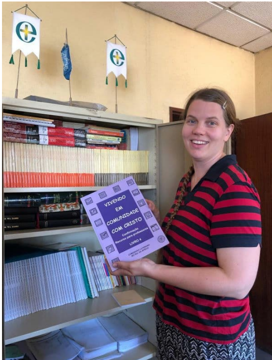
Kuvassa kristillisen kasvatuksen toimiston kaapilla esittelen rippikouluopetuksen kirjaa kirjasarjasta, jota käytämme kirkossa.

Minulla on ollut vauhdikkaat ja työntäyteiset (Suomen syys)kuukaudet - täällähän olemme eläneet ”kevättä” ja nyt ”kesää”. Tämä marraskuu on vielä eri tehtäviä täynnä. Tiivis, mutta mielenkiintoinen työrupeama: suunniteltavaa ja valmisteltavaa, kommentoitavaa, työmatkoja, erityisempiä ohjelmia ja vieraita. Kun on eri juttuja tehtäväksi, niin minulla on yleensä hyvä olo. Tunnen eläväni ja olevani hyödyksi. Mutta samalla odotan kyllä jo joulukuun rauhaa. Jospa silloin sitten palaudutaan. Pysy tasapaino.